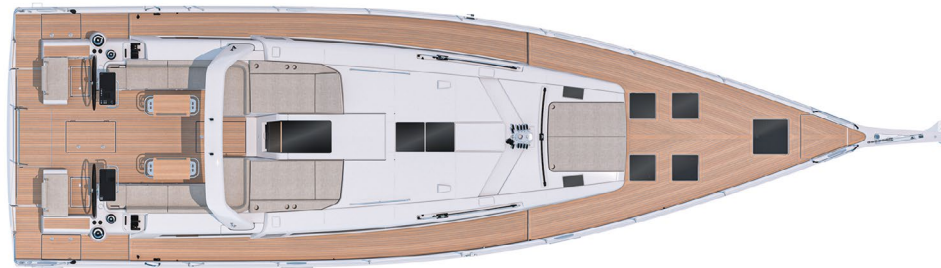
MAIN DECK PONT PRINCIPAL