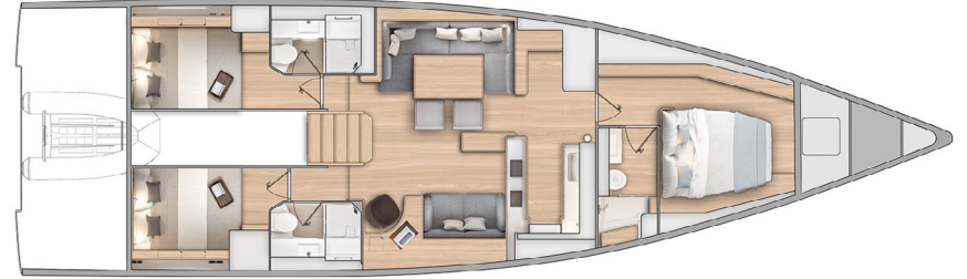
LOWER DECK - 3 CABINS / 3 HEADS + SAIL LOCKER PONT INFERIEUR - 3 CABINES / 3 SALLES D'EAU + SOUTE A VOILES